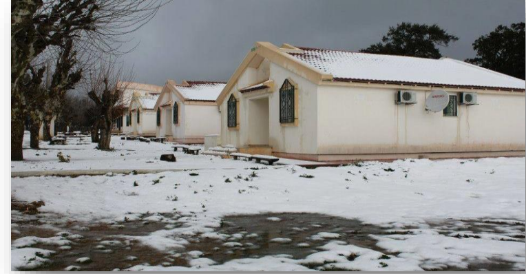
مركز الاصطيفاف المغاربي عين سلطان