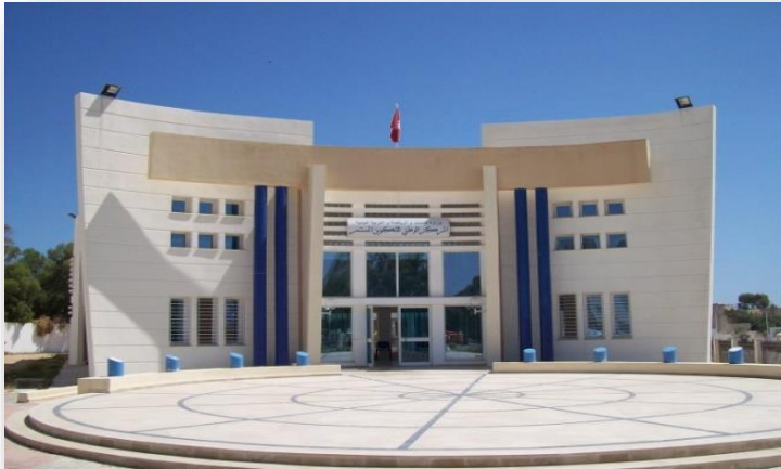
المركب الشبابي علي السخيري المنستير