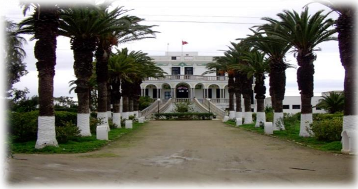
مركز الاصطياف الرجاء نابل