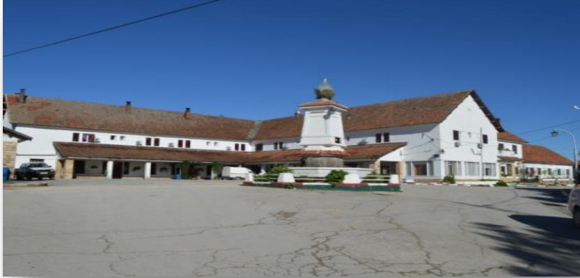
مركز الاصطيفاف بني مطير