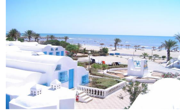
مركز الاصطياف أغير جربة