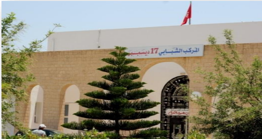
المركب الشبابي 17 ديسمبر سيدي بوزيد