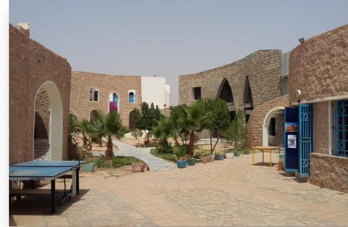
المركب الشبابي تطاوين